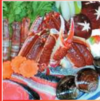
ことぶきなべセット (寄せ鍋・うどん・フルーツ)