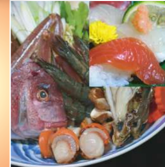
寄せ鍋にぎり寿司セット (付きだし・にぎり寿司・寄せ鍋・フルーツ)