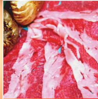
しゃぶしゃぶセット (付きだし・しゃぶしゃぶ・ごはん・フルーツ)