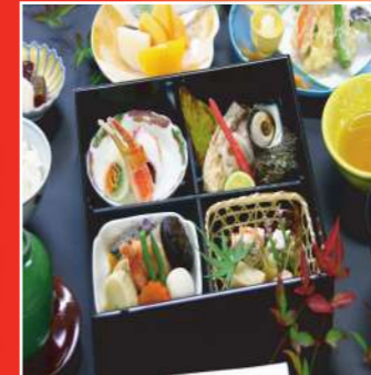
会席セット「かえで」