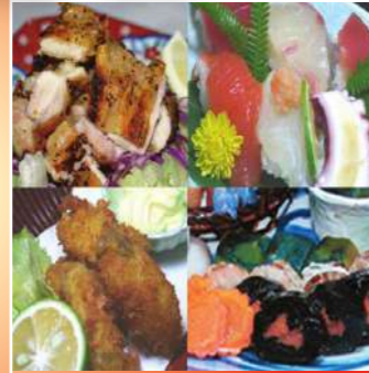
皿盛りオードブルセット (お寿司・盛り皿・揚げ物・焼き物・フルーツ)