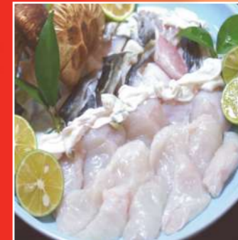
てっちりセット (付きだし・てっさ・てっちり・雑炊・フルーツ)