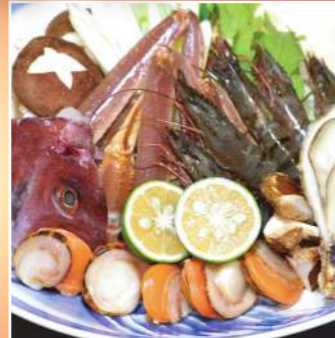
寄せ鍋セット (付きだし・寄せ鍋・雑炊・フルーツ)