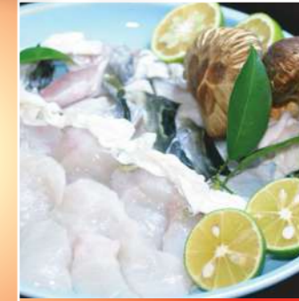
てっちりフルコースセット (付きだし・てっさ・てっちり・白子・唐揚げ・雑炊・フルーツ)