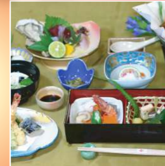
和牛ロース陶板焼 会席セット「つばき」