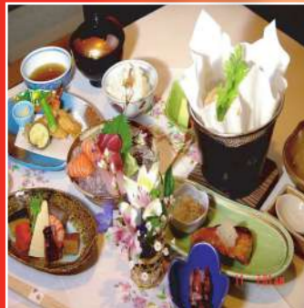
会席セット「りんどう」 (付きだし・湯葉の湯豆腐・お造り・焼き物・揚げ物・ごはん・フルーツ)