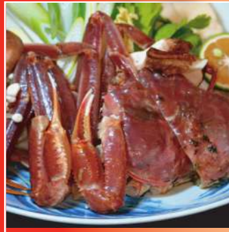
かにすきセット (付きだし・かにすき・ぞうすい・フルーツ)